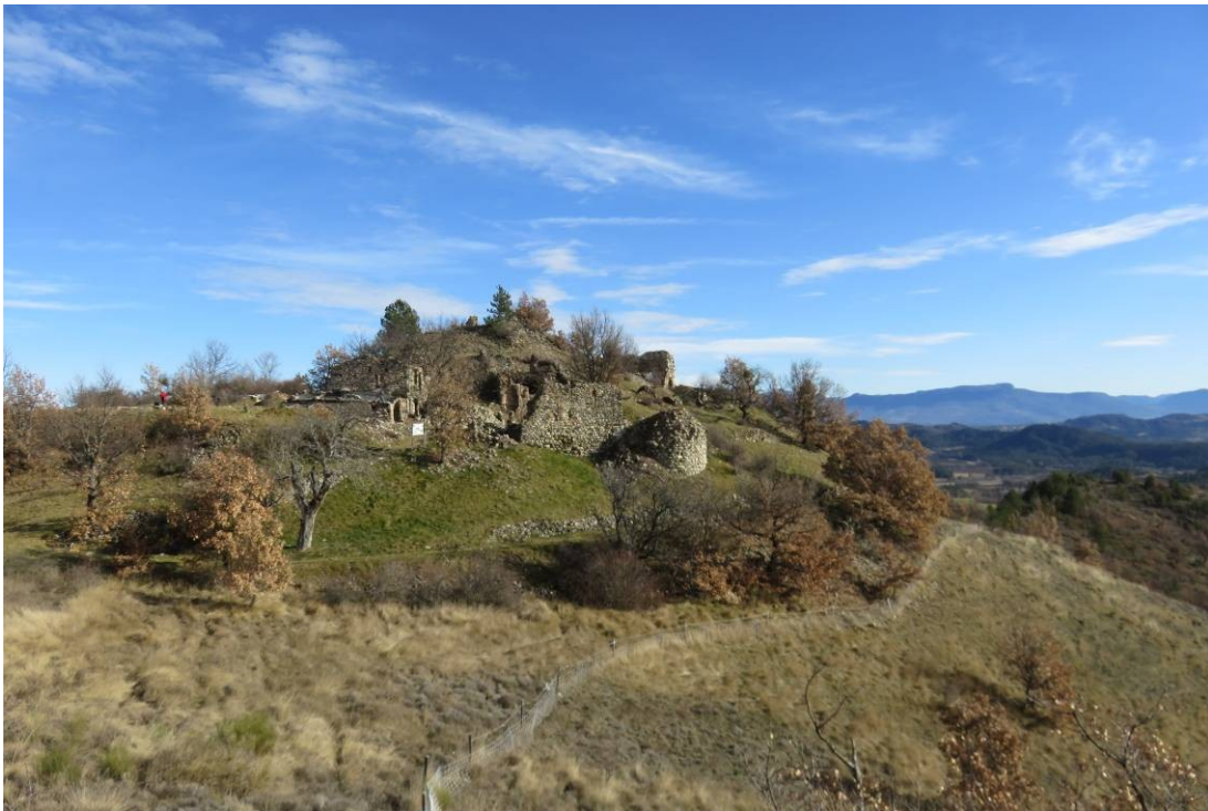
Hameau ruiné de Vieil Arzeliers ou Villevieille

Le Club de Randonnée Caturige ne saurait être tenu pour responsable en cas d'utilisation des fiches de randonnée hors du contexte de l'association.