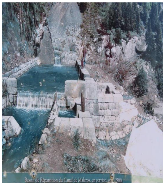
Bassin de Répartition du Canal de Malros, en service, vers 1900